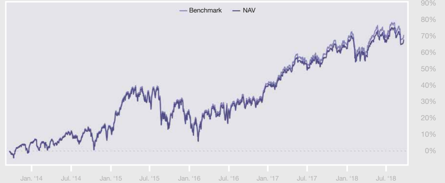
De weergegeven rendementen zijn inclusief dividend en na aftrek van kosten. De Think AEX UCITS ETF's hanteren een bruto herbeleggingsindex in tegenstelling tot veel andere ETF's en beleggingsfondsen die een netto herbeleggingsindex als benchmark hanteren. Het vergelijken met een bruto herbeleggingsindex is de meest zuivere vorm aangezien dit ervanuit gaat dat u de ingehouden dividendbelasting kunt terugvorderen.

Indexbeleggen verschilt van actief beleggen zoals toegepast bij de meeste beleggingsfondsen. Met actief beleggen wordt geprobeerd om een beter resultaat dan de markt te behalen door actief aandelen en obligaties te selecteren. Bij indexbeleggen wordt de markt zo nauwkeurig mogelijk gevolgd wat leidt tot twee opvallende conclusies: